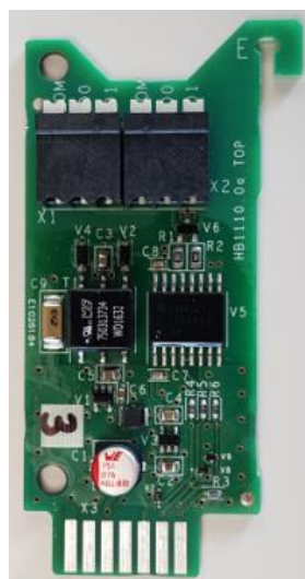
Figure 2 : Module d'extension Modbus (E)

Le module d'extension Modbus sera inséré dans l'emplacement situé à l'extrême droite du module CoreSense, comme illustré à la Figure 2 ci-dessous. L'emplacement correct pour le module Modbus est signalé par la lettre E .