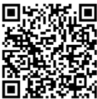
Figure 1 : Code QR

Plus de détails sur la communication sont fournis dans l'information technique TI_Stream_NGCS_02 « Next Generation CoreSense™ Modbus Interface Description » qui peut être téléchargée à partir de notre site web à l'adresse www.climate.emerson.com/fr-fr/products ou directement en scannant le code QR ci-dessous ou sur le couvercle du boîtier électrique du compresseur.