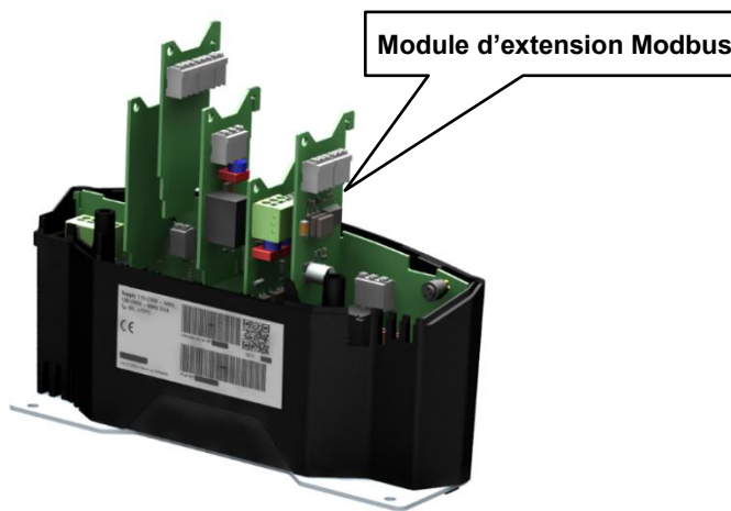
Figure 3 : CoreSense Next Gen avec modules